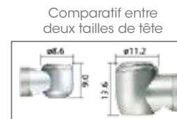
S-Max Pico Tête ultra mini Ti-Max X600L (tête standard)

Raccords disponibles : NSK®, Bien-Air®, W&H®, Kavo®, Sirona®.